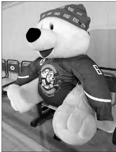
Талисману команды «медвежий оскал» и вправду ни к чему...

Поинтересовались мы и тем, откуда же команда будет пополняться кадрами, если из местной любительской команды в состав попала лишь одна девушка. В Ухте нет даже спе-